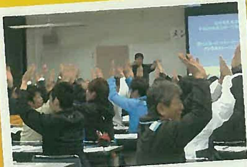
★ ペアで気持ちを高めるテクニック