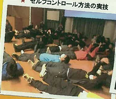
★ セルフコントロール方法の実技